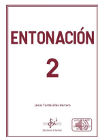
Entonación 2 Jesús Tordesillas Herrero Si bemol Edicións 2022