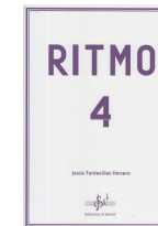
Ritmo 4 Jesús Tordesillas Herrero Si bemol Edicións 2019