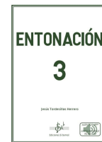
Entonación 3 Jesús Tordesillas Herrero Si bemol Edicións 2022