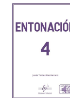
Entonación 4 Jesús Tordesillas Herrero Si bemol Edicións 2022

O resto do material didáctico será indicado polo profesorado ao inicio do curso.