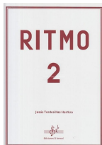
Ritmo 2 Jesús Tordesillas Herrero Si bemol Edicións 2019