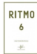
Ritmo 6 Jesús Tordesillas Herrero Si bemol Edicións 2020