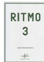
Ritmo 3 Jesús Tordesillas Herrero Si bemol Edicións 2019