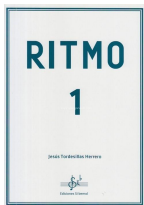
Ritmo 1 Jesús Tordesillas Herrero Si bemol Edicións 2019